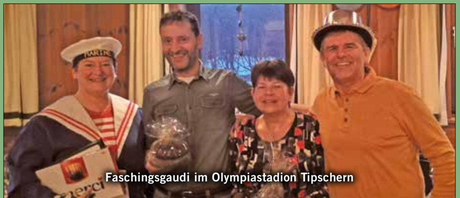
Faschingsgaudi im Olympiastadion Tipschern