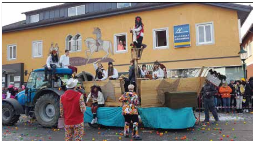
Faschingsumzug in Gröbming