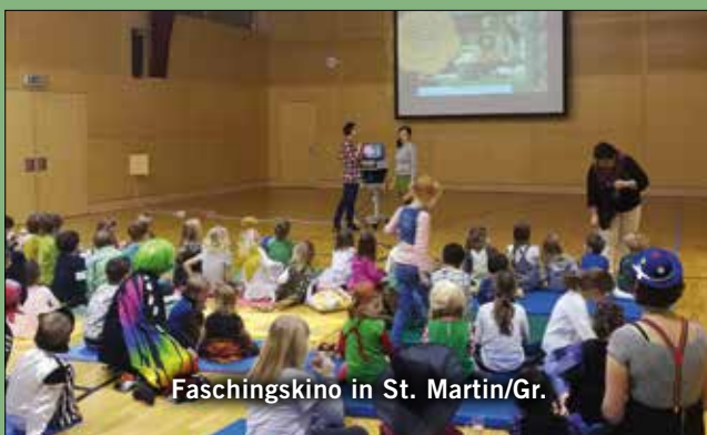
Faschingskino in St. Martin/Gr.