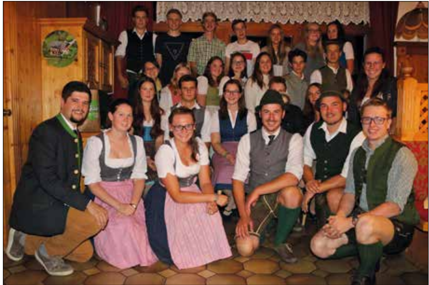
Gründung der Landjugend Mitterberg-Sankt Martin